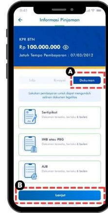
4. a. Pilih opsi "Dokumen" untuk akses dokumen legalitas 4. b. Pilih lanjut untuk melanjutkan transaksi