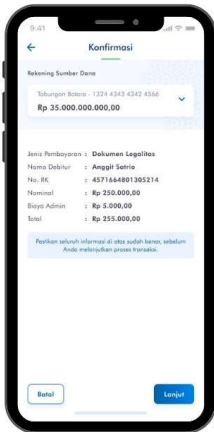
5. Konfirmasi Pembayaran