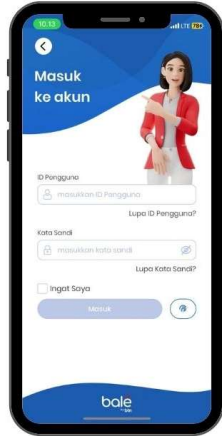
2. Log In