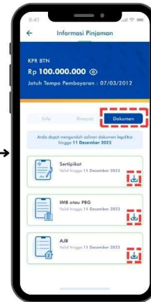
9. Dokumen Legalitas dapat diunduh