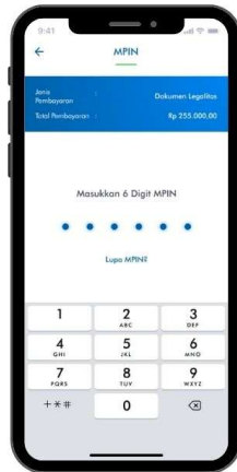
6. Isi Pin