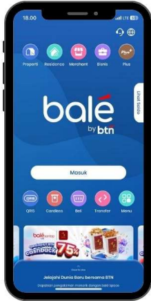
1. Tampilan Utama Bale by BTN